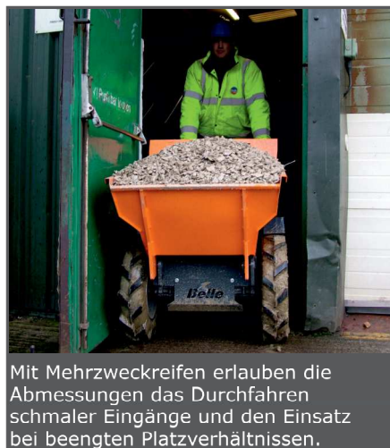
Mit Mehrzweckreifen erlauben die Abmessungen das Durchfahren schmaler Eingänge und den Einsatz bei beengten Platzverhältnissen.