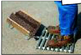
Für groben Schmutz unter dem Schuh...