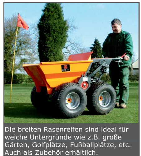
Die breiten Rasenreifen sind ideal für weiche Untergründe wie z.B. große Gärten, Golfplätze, Fußballplätze, etc. Auch als Zubehör erhältlich.