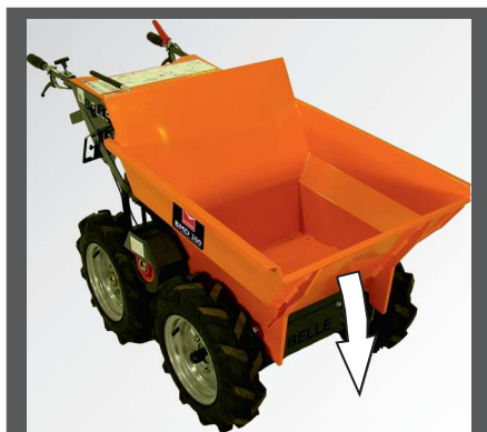
Die untere Stellung der Kippmulde erlaubt ein müheloses und schnelles Abkippen, auch bei voller Ladung - perfekt austariert.