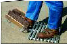
...und den Schmutz rundherum