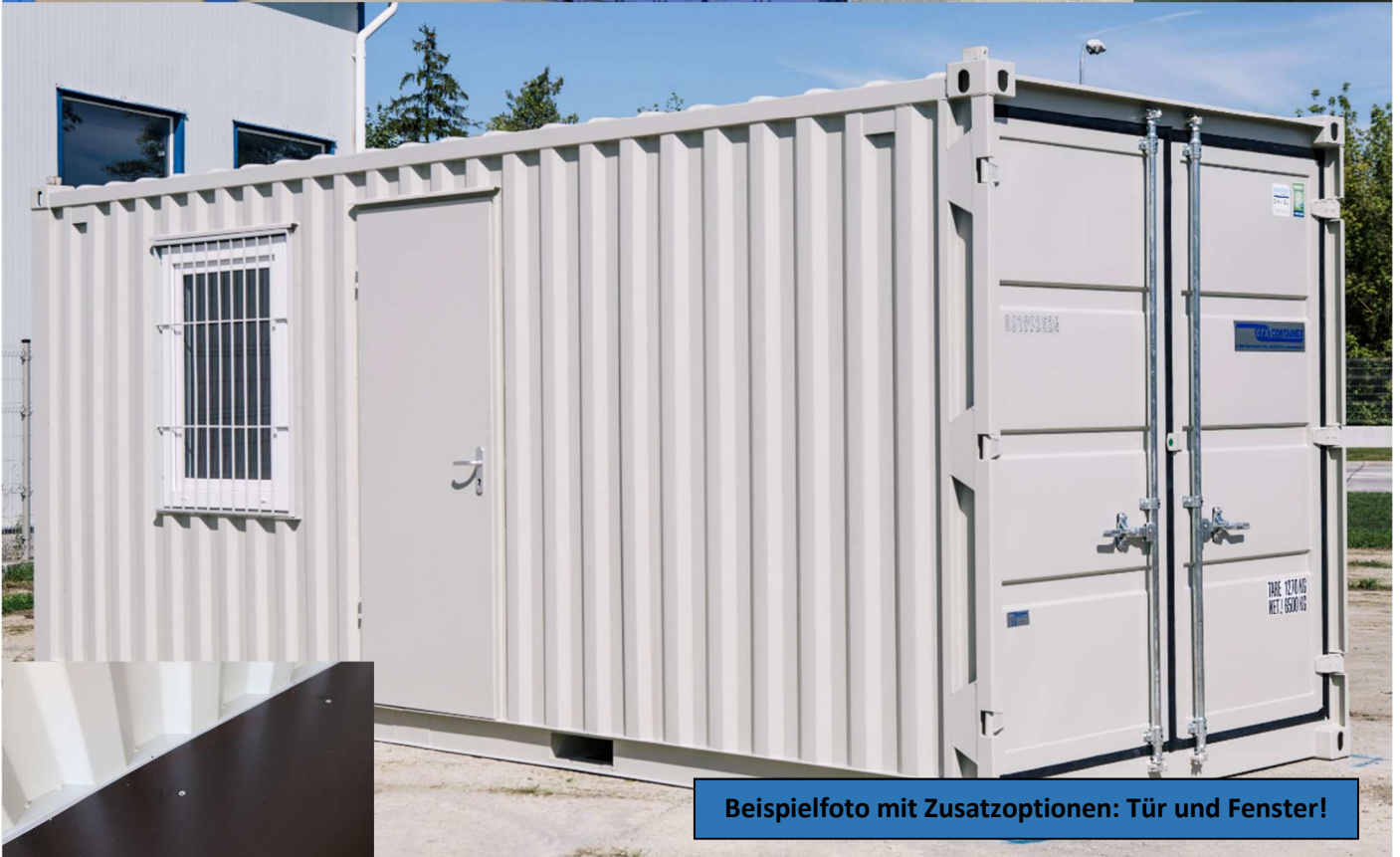
Beispielfoto mit Zusatzoptionen: Tür und Fenster!